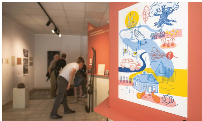
Paroda Baltupiuose.