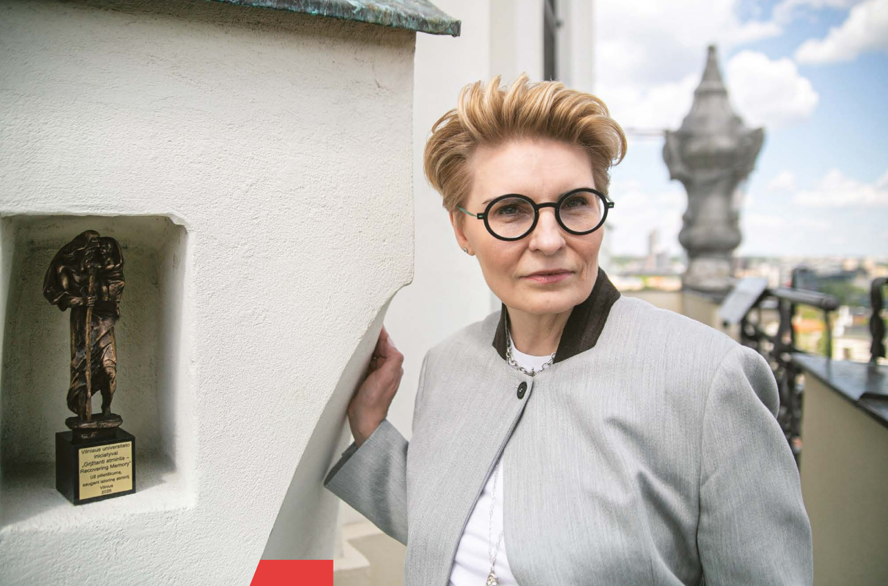
Vilniaus šv. Jonų bažnyčios varpinės bokšto apžvalgos aikštelėje.

ir studentas virsta vilniečiu: įsijungia į tam tikras subkultūras, įpranta prie vietinės kavos. Ambicija, noras siekti geriausių dalykų, laisvumas, kūrybiškumas – pagrindiniai vilniečio požymiai. Ypač išskirčiau kūrybiškumą – tai yra labai kūrybingų žmonių miestas.