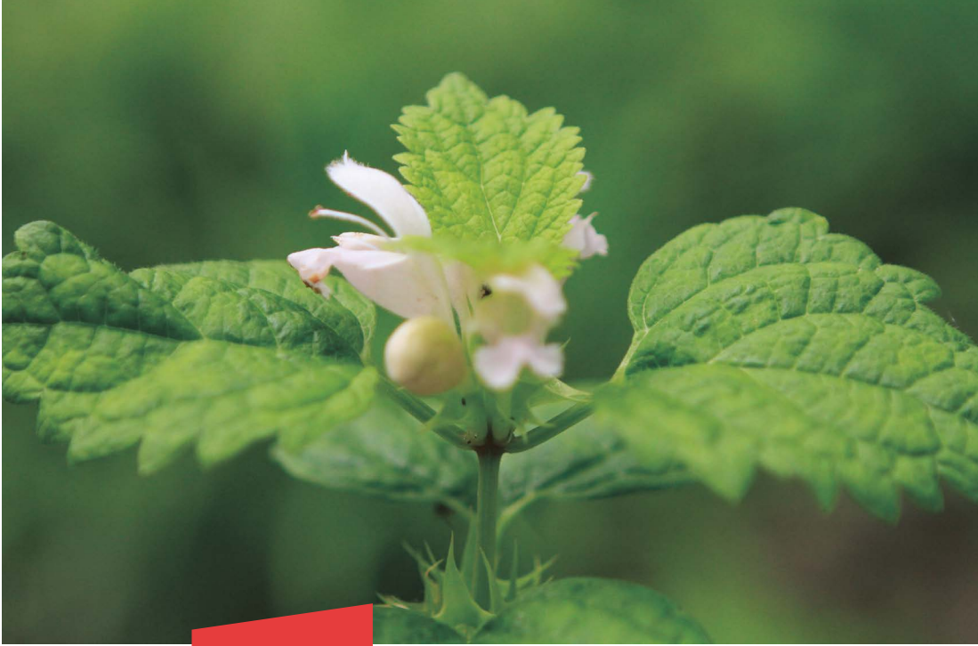
Notrelė Žemaitės skvere.