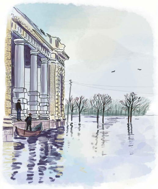
Dabartinė Vrublevskių biblioteka per Vilniaus potvynį 1931-aisiais.

Nuo Karaliaus Mindaugo tilto iki Žaliojo, nuo pirmo iki penkiolikto numerio – nuo aristokratės rezidencijos iki keturių žvaigždučių