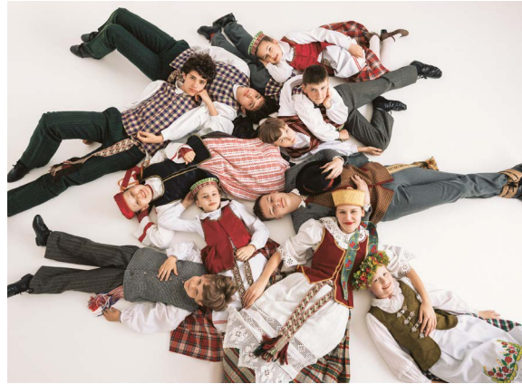
Moksleivių dainų šventės spalvos.