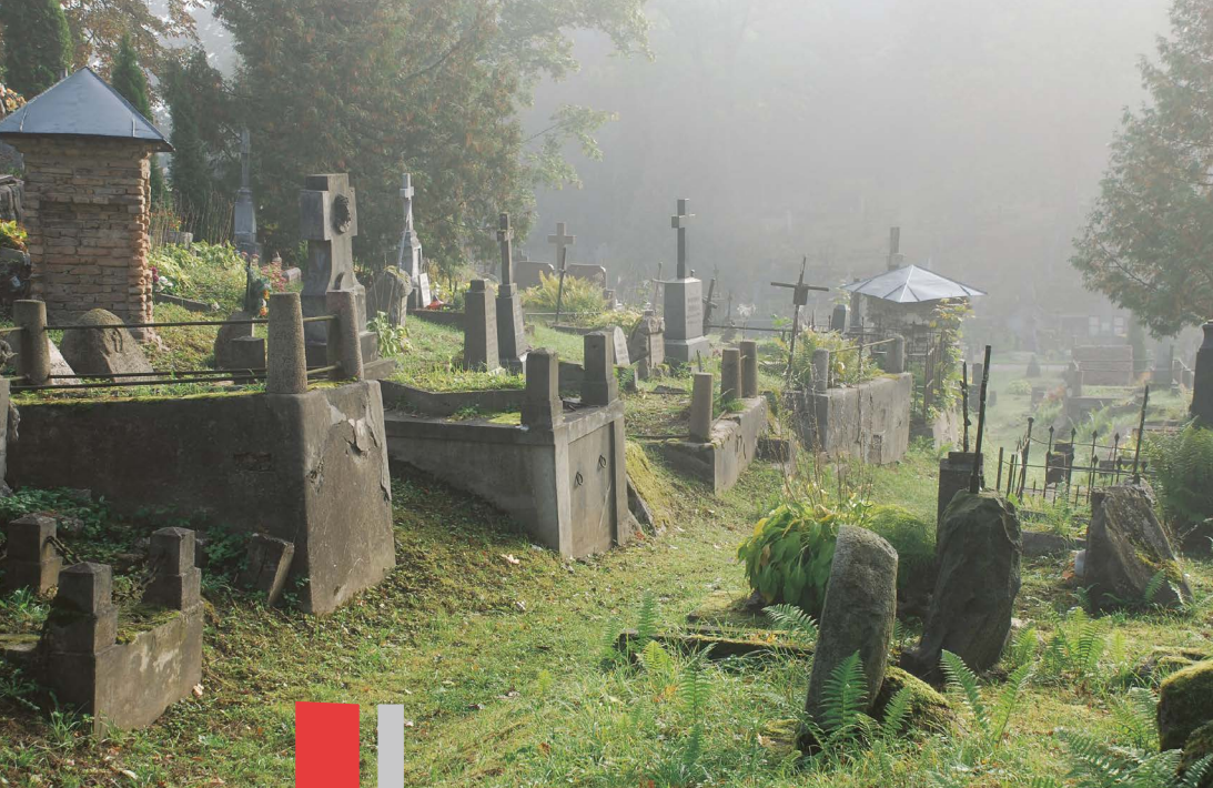
Rasų kapinės įkūnija kapinių-parko idėją.