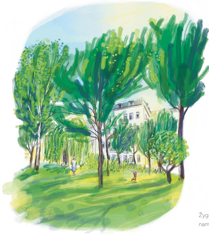
Žygimantų gatvės namo Nr. 10 kiemas.

iškilęs neoklasicizmo bruožų turintis pastatas buvo modernus ne tik išore ar vidumi (jame įrengtas vienas pirmųjų liftų Vilniuje), bet ir idėja – prabangūs butai, skirti nuomai.