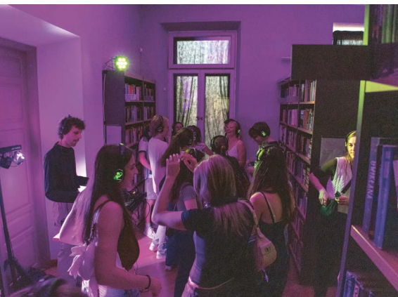
Tylioji diskoteka bibliotekoje.