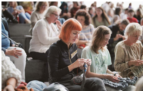
Mezgimo vakarėlis!