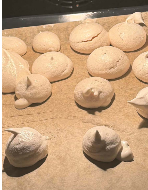
Morengų skonis dovanoja tikrą atostogų vaibą.

Nuo tada, kai sužinojau, kad morengus galima pasigaminti iš akvafabos (avinžirnių skysčio), iš kiaušinių jų nebegaminu. Turiu pasigirti, kad