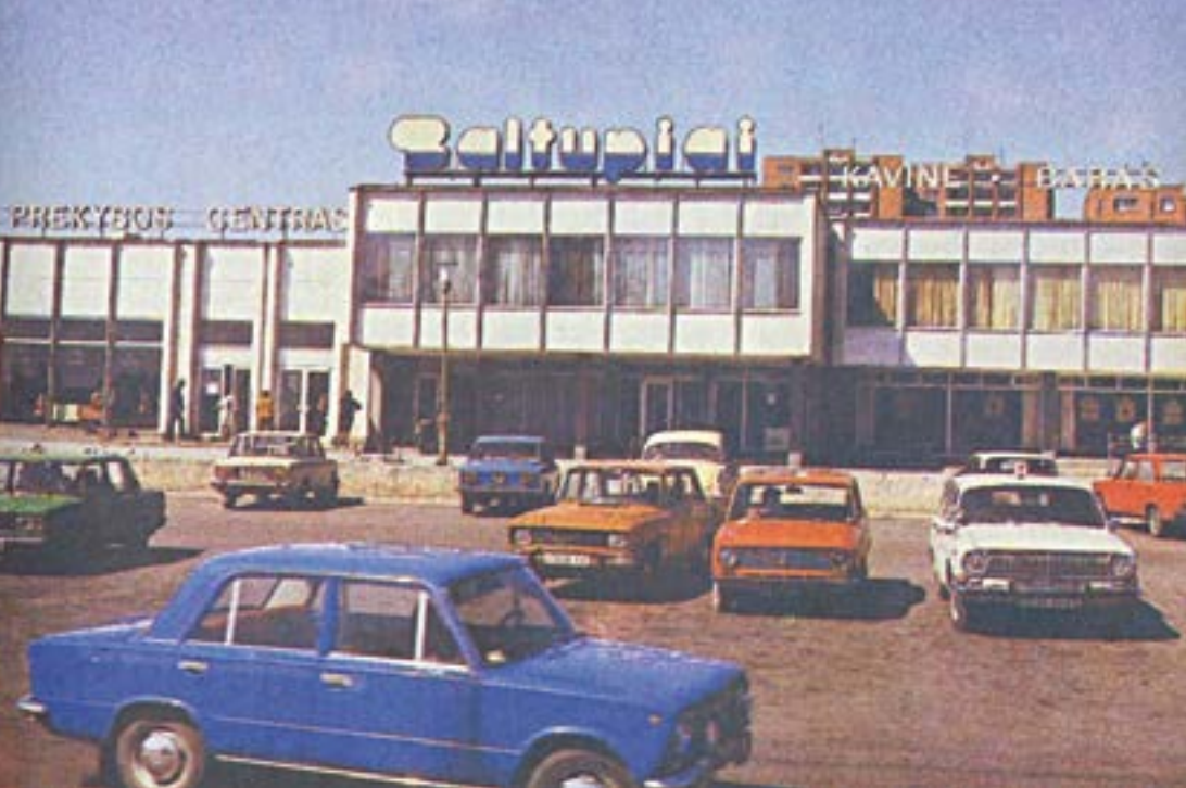
Prekybos centras „Baltupiai“, 1986 m.