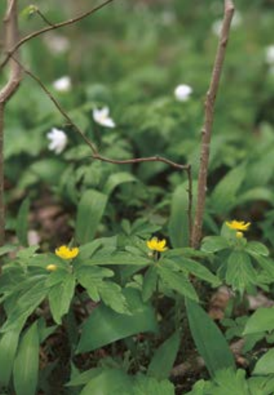
Ar atpažinsite meškinio česnako lapelius? Rugilės Audenienės nuotr.