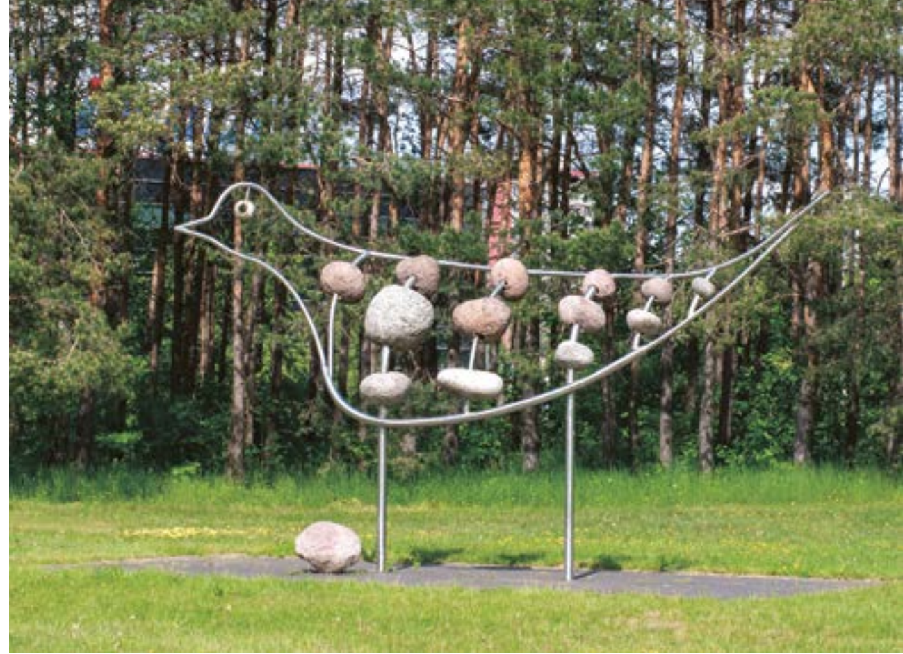
„Karelijos gegutė“ susijusi su Suomija. Vietiniai ją ir lanko, ir puošia.

Vilniečiai kuo puikiau žino ir kitus G. Umbraso darbus – plyteles „Stebuklas“ ir „Obuoliukas“, „Meilės krantus“, mozaiką „Šv. Kristoforas“ ant Vilniaus miesto savivaldybės pastato.