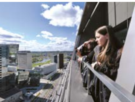
„Neakivaizdinio Vilniaus“ gimtadienis.