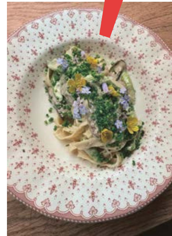
Bobausiai ir kitos miškų gėrybės.

Sostinės restorane deginto cukraus desertų jis nesiūlo. Užtat iš pirmo po žiemos