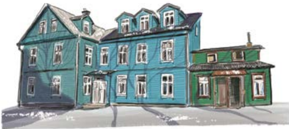
Vienos gatvės istorija