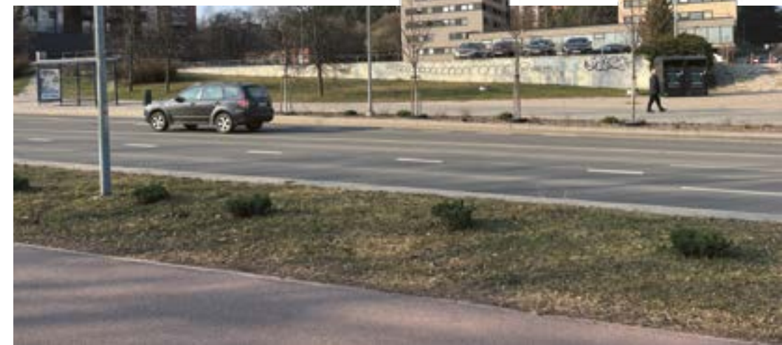
Dabartiniai Baltupiai.

Štai tokios Baltupių rajono istorijos detalės. Su rajonu susijusias įdomybes ir istorinius faktus dar renkame, kaupiame, sisteminame ir ruošiamės jus pakviesti į parodą apie Baltupius, kurią gegužės mėnesį Vilniaus miesto muziejus planuoja atverti ne kur kitur, o Baltupiuose!