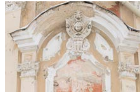
Švč. Jėzaus širdies bažnyčia.