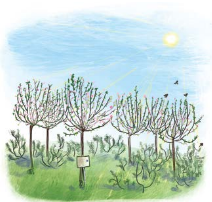
Migdolų parkas žaliuoja priešais Bebrų salą.