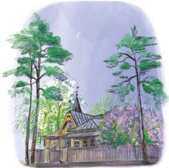
Vienos gatvės istorija

studija, filmavimo paviljonai, buvo garsinami filmai. Čia dirbo žymiausi Lietuvos kino režisieriai, tokie kaip Vytautas Mikalauskas, Nikonoras Bernotas, Raimondas Vabalas, Vytautas Žalakevičius. Vyresni gausios kinematografininkų šeimos atstovai prisimena, kad čia buvo ir kino salė, veikė bufetas, o kiemo viduryje kėpsojo didelė gėlių klomba, darbuotojų vadinama nežinomo režisieriaus kapu.