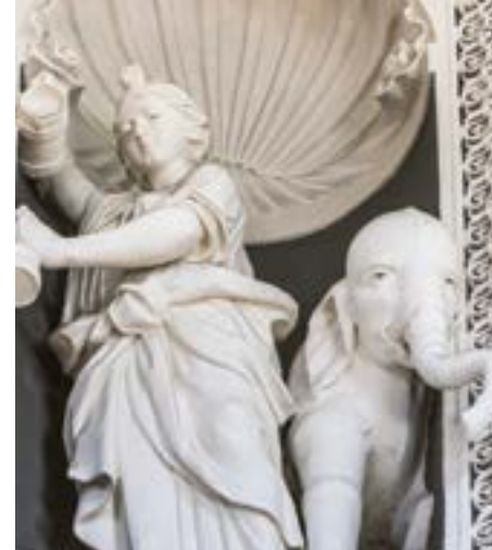
Katedros gyvūnai.