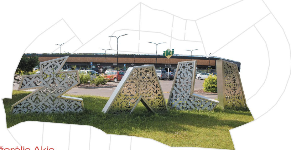
Prekybos centras „Žali“

Prekybos centro aplinka patogi dviratininkams, o modernią dviračių trasą, kurioje galima atlikti triukus, pamėgo ir mažieji balsiečiai, ir suaugusieji. Šalia centro įrengta moderni vaikų žaidimų aikštelė.