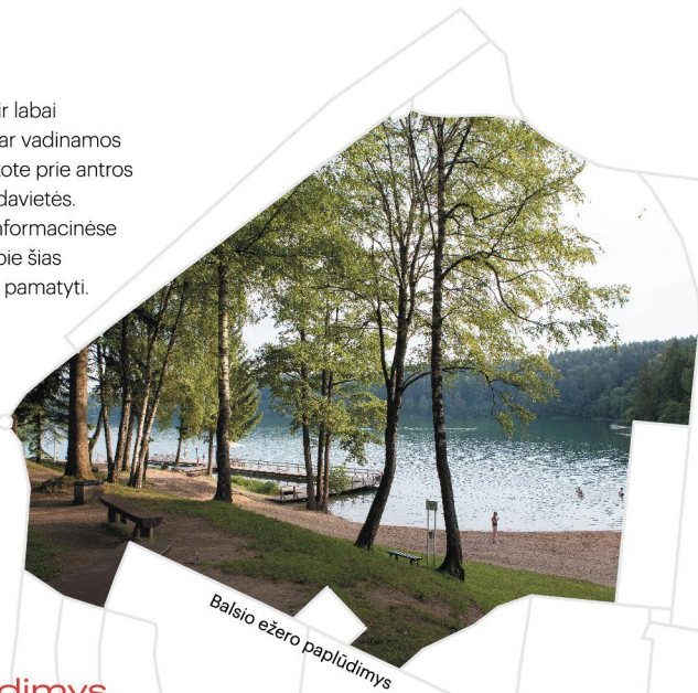
Balsio ežero paplūdimys

Šiltuoju metų laiku čia žydi itin retos ir labai saugomos plačialapės klumpaitės, dar vadinamos lietuviškomis orchidėjomis! Jūs atvykote prie antros pagal dydį Lietuvoje šių retų gėlių radavietės. Visą informaciją rasite net dviejose informacinėse lentose. Tikimės, kad pavyks ne tik apie šias nuostabias gėles paskaityti, bet ir jas pamatyti.