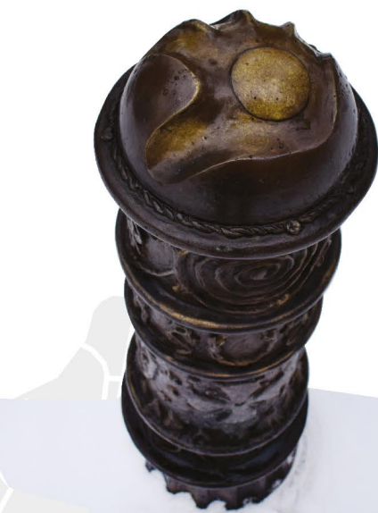
Skulptūra „Jėgos vieta“ UMI kieme

2019 m. sausio 10 d., minint šimtąsias architekto ir skulptoriaus Antano Vivulskio mirties metines, Užupį papuošė naujas akcentas. Bronzinė kareiviška milinė primena, kodėl talentingas kūrėjas paliko pasaulį būdamas vos 41-erių. 1919 m. A. Vivulskis prisijungė prie Vilniaus savignos būrio savanorių, gynusių miestą nuo artejančių bolševikų. Žvarbią sausio 3-iosios naktį prie šio namo eidamas sargybą A. Vivulskis kitam