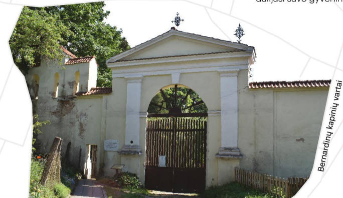
Bernardinų kapinių vartai