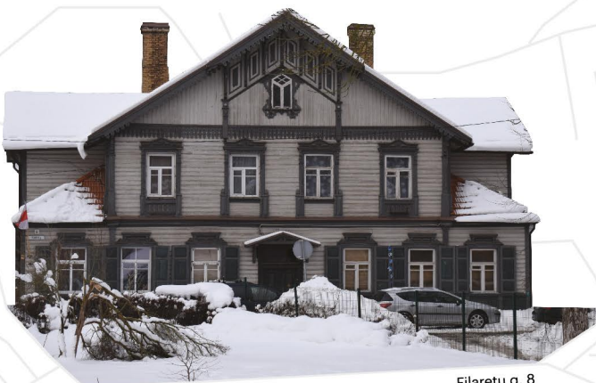
Filaretų g. 8

XIX a. II p., jo pirminė paskirtis buvo gyvenamoji (tokia ir išliko). Beje, Užupyje prasidedanti ir iki Rokantiškių kalvų besitęsianti Filaretų gatvė primena, kad šias vaizdingas apylinkes prieš porą amžių buvo ypač pamėgę Adomo Mickevičiaus vedami filomatai ir filaretai.