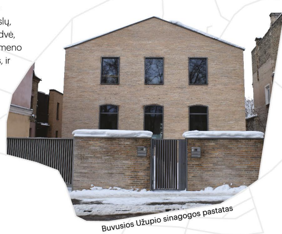
Buvusios Užupio sinagogos pastatas